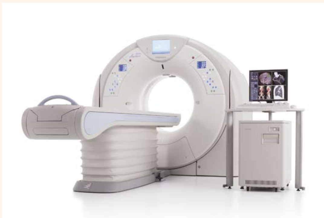
■ 東芝メディカル製マルチスライスCTスキャナ

当院では、高性能の80列マルチスライスCTスキャナを設置しております。 この検査では、患者様が寝台に横になるだけで苦痛なく頭部や胸部・腹部の断層像（輪切り）が鮮明に撮れます。検査はとても簡単で短時間ながら広範囲の撮影が行え、頭部外傷・脳出血・脳梗塞等の頭部疾患から胸部疾患および腹部臓器（肝・胆・膵・腎・膀胱・その他）疾患にいたるまで、全身の診断が可能です。 そして、架台開口径780mmの大型寝台は今まで懸念されがちな圧迫感も感じる事なく、患者様はリラックスしながら安心して検査を受けていただけます。 くわしい検査内容は、医師またはスタッフまでお気軽にお尋ねください。