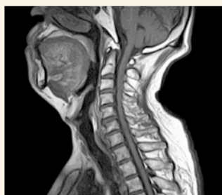
■ 頸 椎