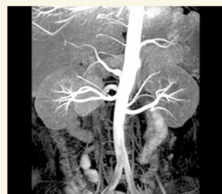
■ 腹部 腎動脈