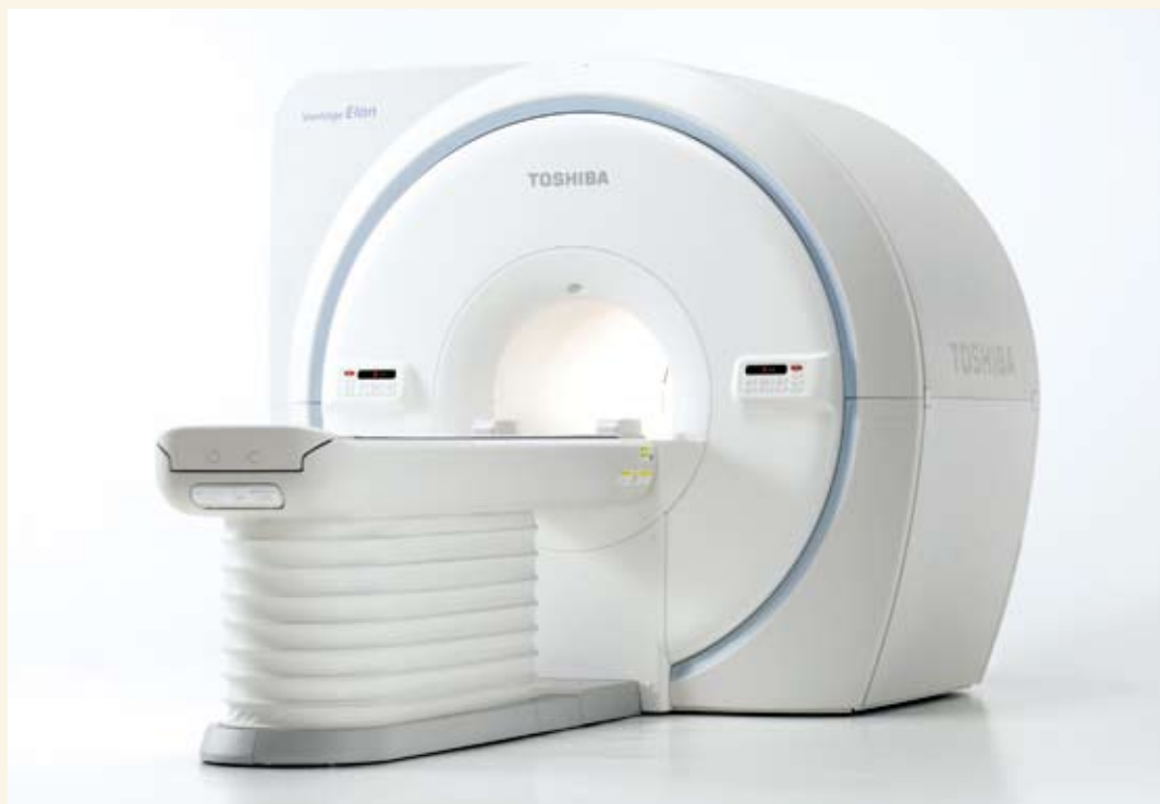
■ 東芝メディカル製磁気共鳴画像診断装置

当院では、東芝メディカル社製1.5テスラMRI装置を導入しました。従来よりも短時間で、鮮明な画像が撮像できる高性能なMRI装置です。検査時の騒音を抑制し、優しい検査を実現した装置です。MRI装置は、磁石と電波により体の様々な部位を画像化します。放射線を使わないので、被ばくすることはありません。詳しい検査内容は、医師またはスタッフまでお気軽にお尋ねください。