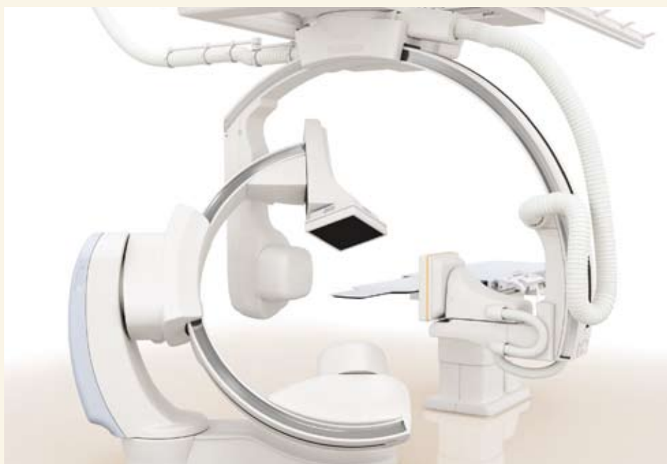
■ 東芝メデイカル製循環器X線診断システム

当院の血管撮影室には、最新型の血管撮影装置が設置されています。 この装置は、従来の血管撮影装置よりも少ないX線で鮮明な撮影が行え、心血管検査を 主体に観察しますが、一度に広範囲の検査が可能なので短時間で高精度の検査・治療 が実現し、今後の治療計画にもお役立ていただけます。 検査はとても簡単で、患者様には不安感や苦痛を与えず安全かつ効率的に行われます。 くわしい検査内容は、医師へまたはスタッフまでお気軽にお尋ねください。