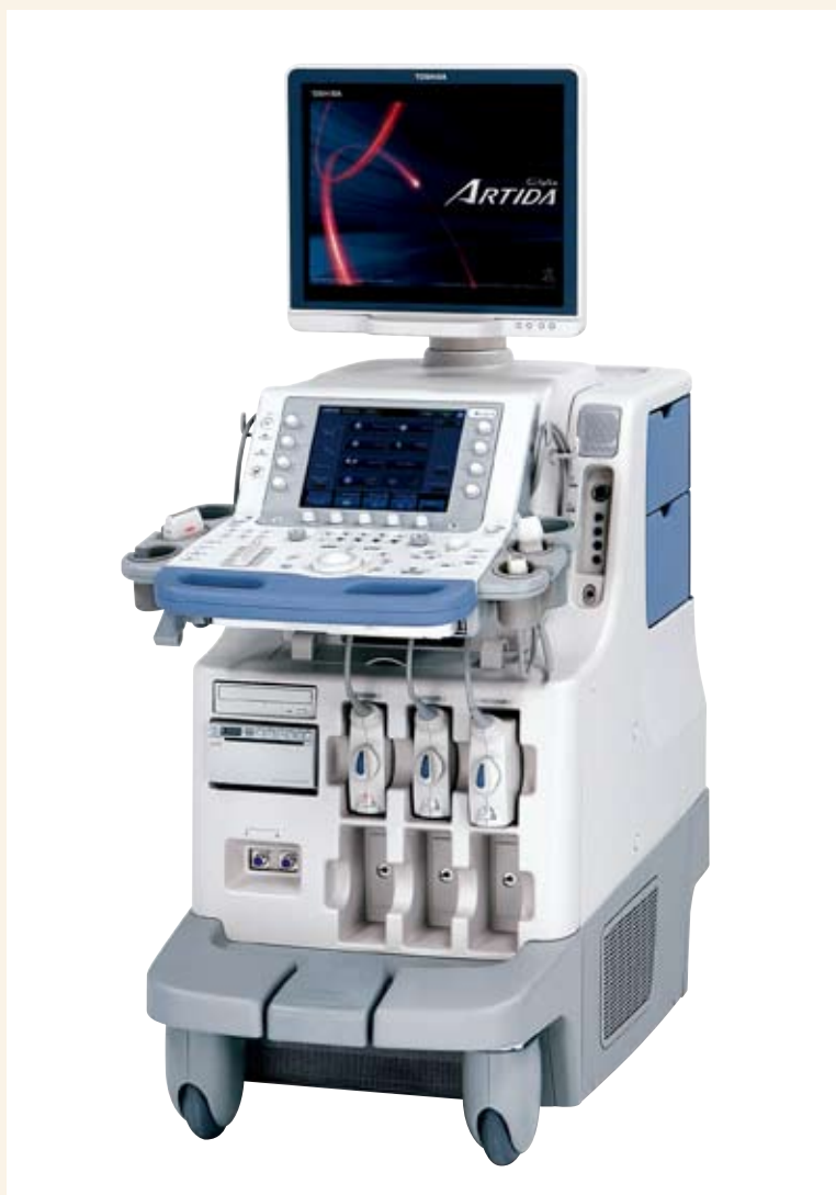
■ 東芝メディカル製フルデジタル超音波診断装置

当院では、この度最新式のフルデジタル超音波診断装置を設置致しました。この検査は、探触子(プローブ)を体表に当てるだけで、心臓の形態や動態など血流の情報が短時間で得られ、患者様はリラックスしながら安心して受診いただけます。さらにこの新型超音波装置には、「最新の壁運動解析機能」が搭載されており、 虚血性疾患の壁運動追跡 や 非同期収縮 などの状態を詳細に観察・解析することができるので診療の補助となります。詳しい検査内容は、医師またはスタッフまでお気軽にお尋ねください。