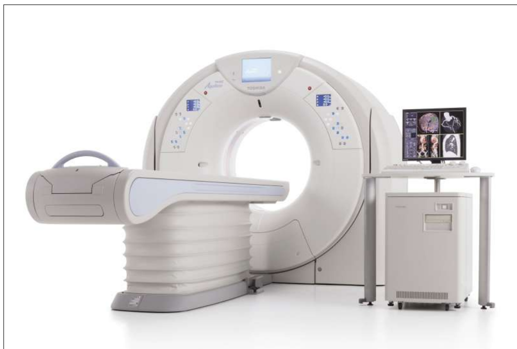
■ 東芝メディカル製マルチスライスCTスキャナ

当院では、高性能の80列マルチスライスCTスキャナを設置しております。 この検査では、患者様が寝台に横になるだけで苦痛なく頭部や胸部・腹部の断層像（輪切り）が鮮明に撮れます。検査はとても簡単で短時間ながら広範囲の撮影が行え、頭部外傷・脳出血・脳梗塞等の頭部疾患から胸部疾患および腹部臓器（肝・胆・膵・腎・膀胱・その他）疾患にいたるまで、全身の診断が可能です。 そして、架台開口径780mmの大型寝台は今まで懸念されがちな圧迫感も感じる事なく、患者様はリラックスしながら安心して検査を受けていただけます。 くわしい検査内容は、医師またはスタッフまでお気軽にお尋ねください。