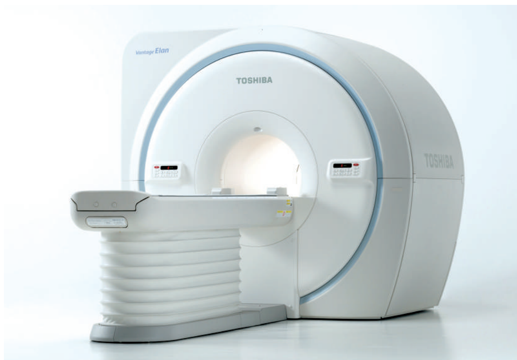
■ 東芝メディカル製磁気共鳴画像診断装置

当院では、東芝メディカル社製1.5テスラMRI装置を導入しました。従来よりも短時間で、鮮明な画像が撮像できる高性能なMRI装置です。検査時の騒音を抑制し、優しい検査を実現した装置です。MRI装置は、磁石と電波により体の様々な部位を画像化します。放射線を使わないので、被ばくすることはありません。詳しい検査内容は、医師またはスタッフまでお気軽にお尋ねください。