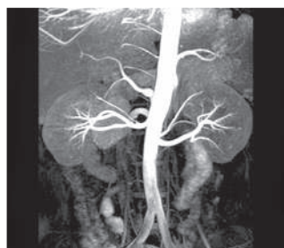
■ 腹部 腎動脈