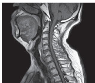
■ 頸 椎